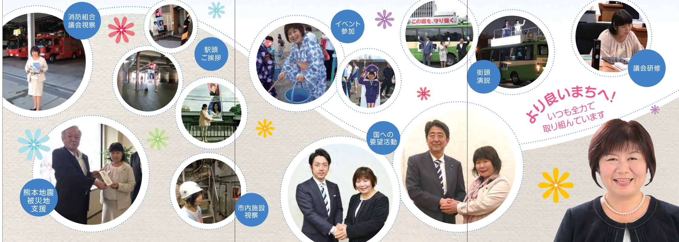
消防組合 議会視察